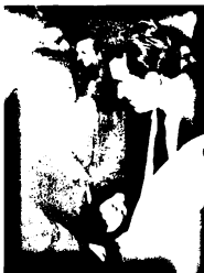
Ὁ Νίκος Μπελογιάννης μέ τήν Έλλη Παππά σ' ἓνα διάλειμμα τῆς δίκης.

30.3.1952: Έκτέλεση τοῦ Νίκου Μπελογιάννη.